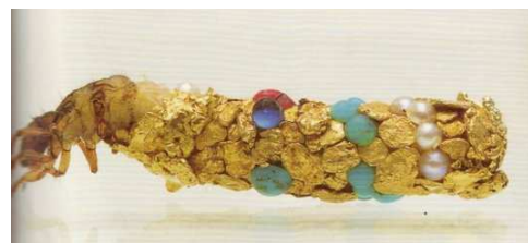
La larve