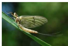
Larve d'éphémère (ecoloT6/6)

La larve vit dans l'eau durant environ deux à trois ans. Une fois mature, elle revient à la surface, cette forme est appelé nymphe. C'est là qu'a lieu la métamorphose. Le dos de la larve se fend et l'adulte s'extrait. Une fois adulte, l'éphémère s'accouple en vol puis meurt. Sa vie adulte dure une journée.