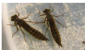
Larve (Société française d'orchidologie)

La larve de libellule peut mesurer de 3 à 6 cm. Comme tous les insectes, elle possède six pattes. Elle reste à l'état larvaire pendant environ 1 à 3 ans. Elle se nourrit de petits poissons, de têtards, de vers d'eau. Une fois arrivée à maturité, la larve sort de l'eau et se déplace sur les plantes au bord de l'eau.