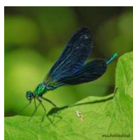
Libellule adulte

La métamorphose de la larve à l'état adulte s'appelle la mue imaginale. Si vous vous baladez au bord d'un ruisseau ou d'un étang, observez bien dans les plantes pour peut être dénicher une exuvie. Il s'agit de la peau rejetée pendant la mue.