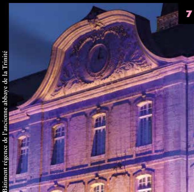
Bâtiment régence de l'ancienne abbaye de la Trinité