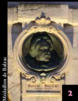
Médaille de Balzac